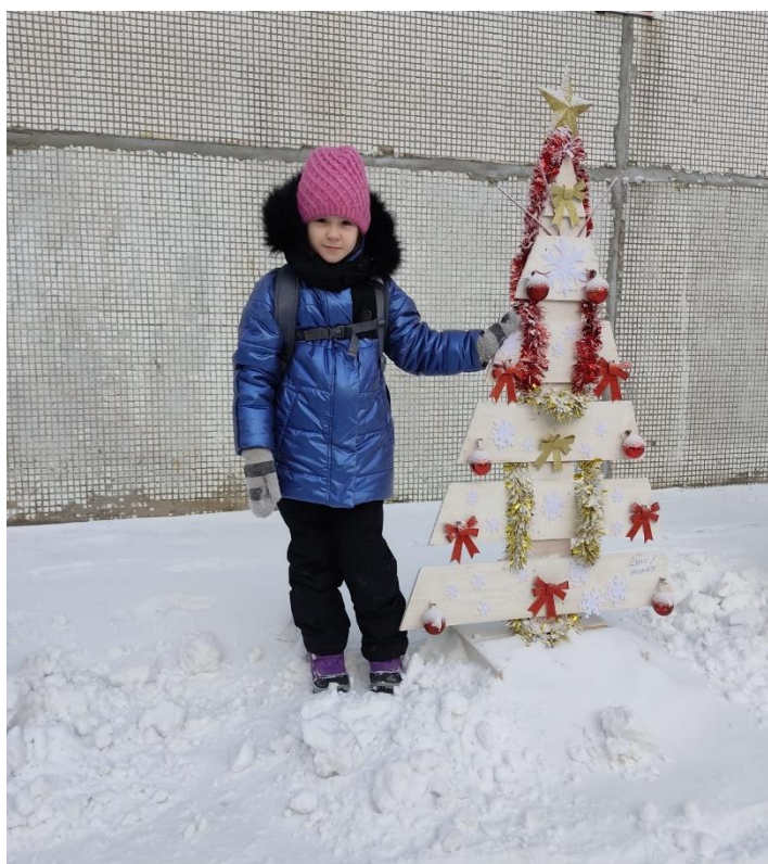
С Наступающим Новым годом, дорогие друзья! Встретимся в следующем году ☺