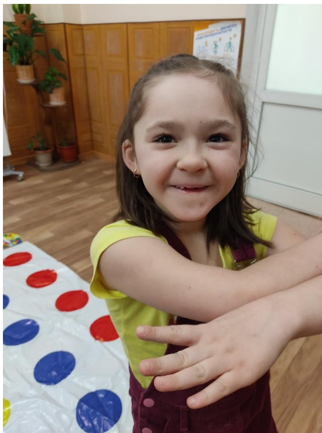
Играть тоже успеваем ☺