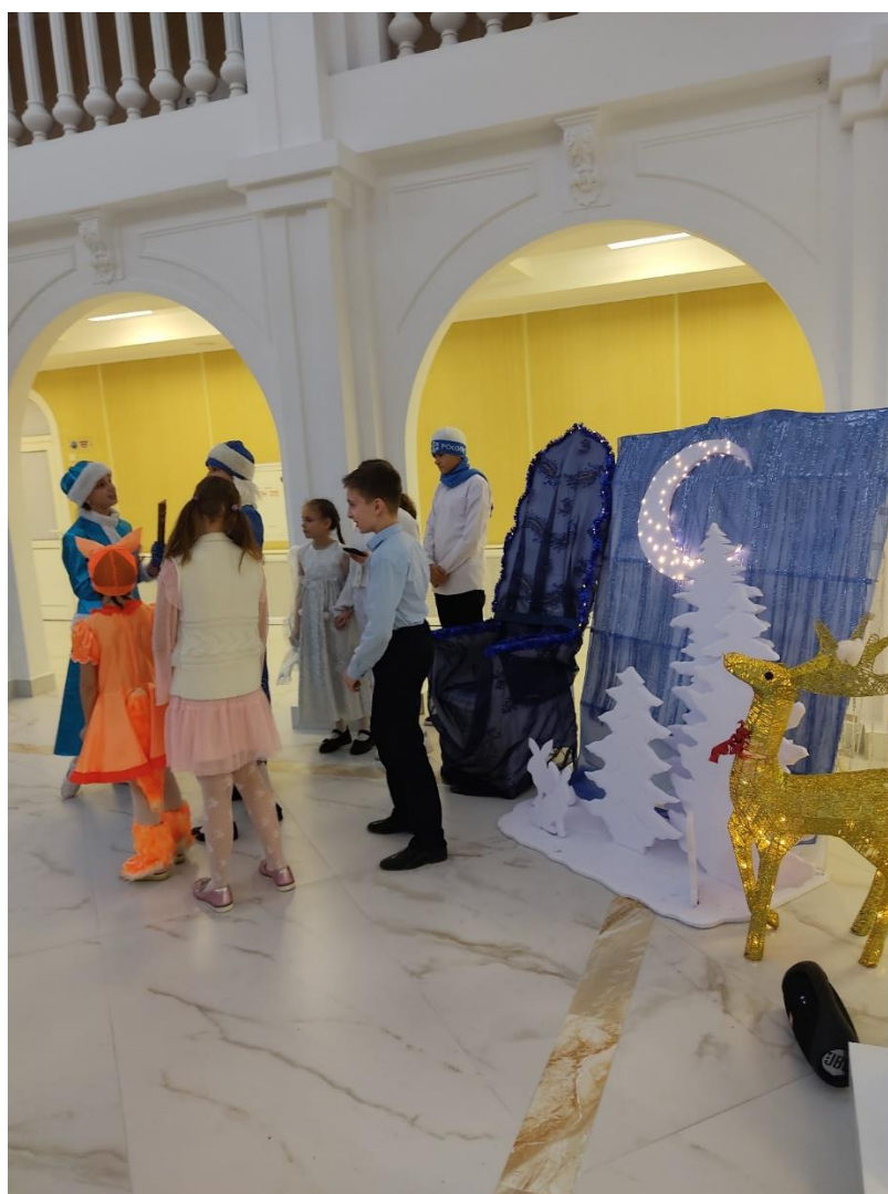
1 группа презентует свою фотозону «В резиденции дедушки Мороза»